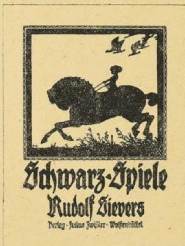
Umschlag der Mappe „Schwarzspiele“