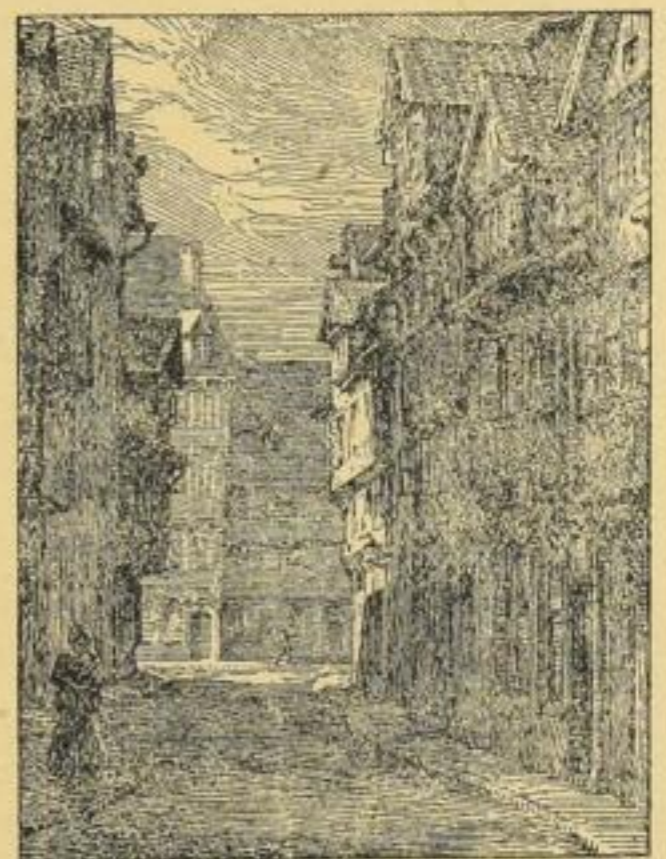
Aus der Mappe „Braunschweig“