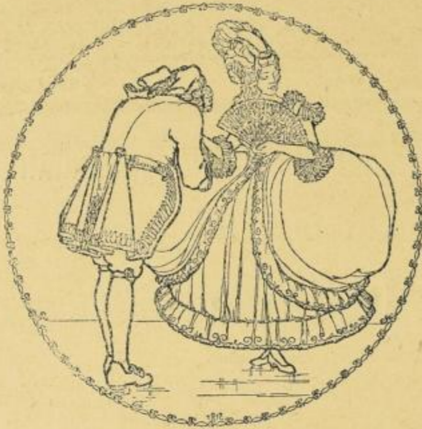
Aus Sievers „Kunterbuntes Bilderbuch“

Auf einem Hügel vor Laon fiel in den letzten Kriegs- wochen der junge Kunstmaler