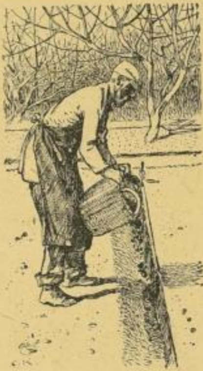
Vorbereitung der Radieschenaussaat.