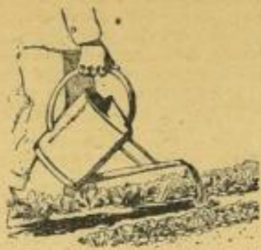
Salat mit der Tülle zwischen den Reihen gießen, nicht überbrausen.