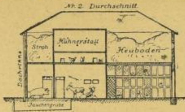
Praktisch angelegter Kleinviehstall.