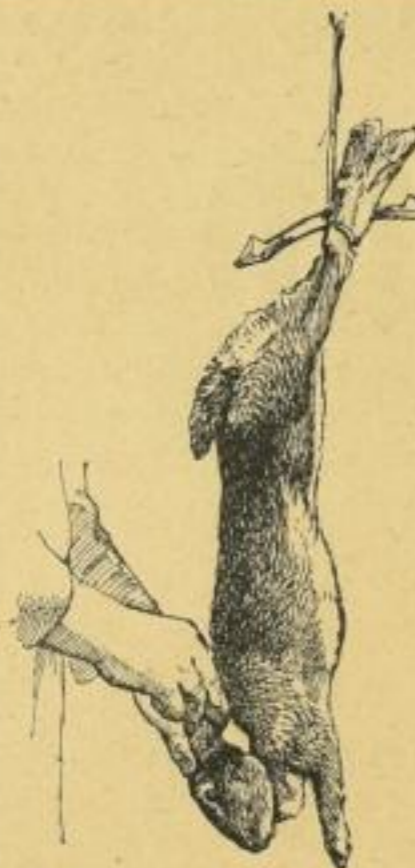
Vom Schlachten der Kaninchen.

◆ Probenummern von beiden Zeitschriften werden auf Wunsch vom Verlage kostenfrei zugesandt. ◆