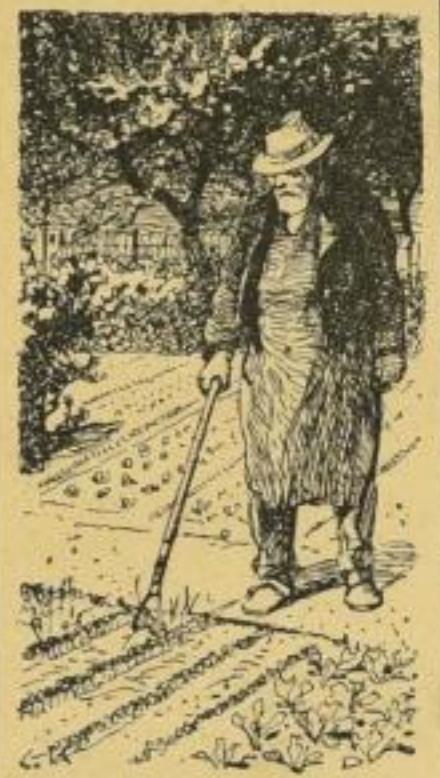
Werkzeug zum mühelosen Lockern der Saatbeete.