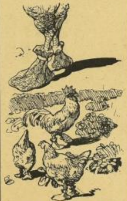
Süßner mit künstlichen Zeugschuhen, die das Krähen und Scharren verhindern.