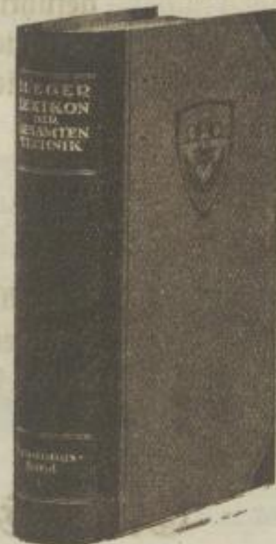
Einband B: In Halbleder-Ausführung • Einband C: In Halbleinen-Ausführung

Deutsche Verlags-Anstalt / Stuttgart, Leipzig, Berlin