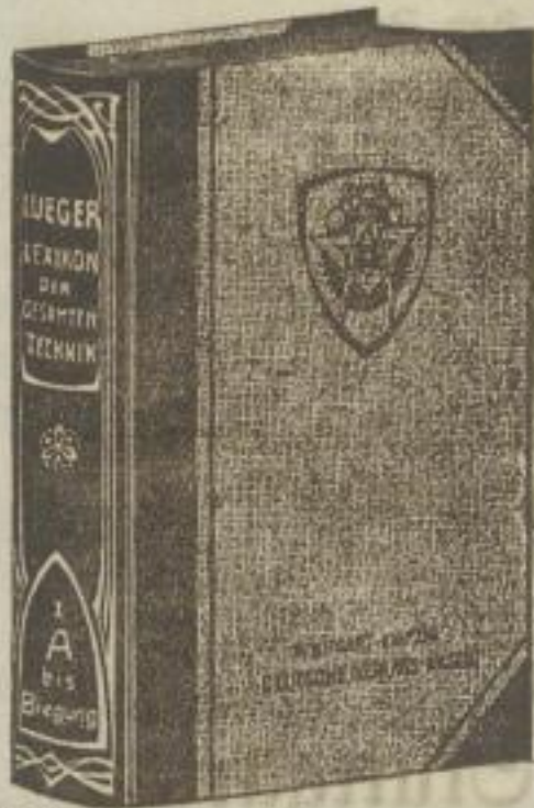
Einband A: Nur in Halbleder-Ausführung

Wir bitten Sie, ihn in entsprechender Anzahl unter Angabe des gewünschten Einbandes nach untenstehenden Abbildungen zu bestellen und allen Abnehmern des Werkes zuzufenden. Bestellzettel liegt bei.