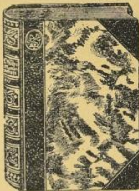
Verkl. Wiedergabe des schönen Einbandes der neuen Auflage von Fr. Kälpe: Mutterchaft