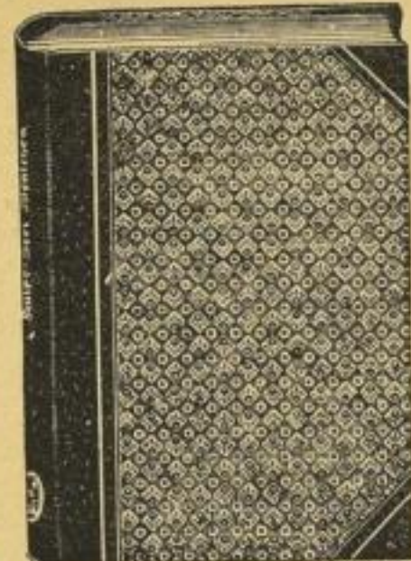
Vertieimerte Wiedergabe des Liebhaber-Einb. d. neuesten Aufl. zu Kälpe: Drei Menschen

Neue Ausgabe auf holzfreiem Papier Gebunden M. 15.— Lieb.-Einband M. 20.—