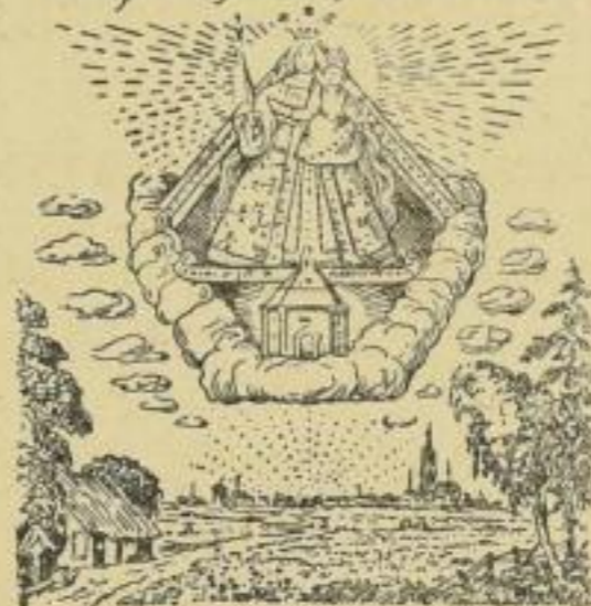
Buison & Bercker G. m. b. H. Kevelaer (Rheinld.)