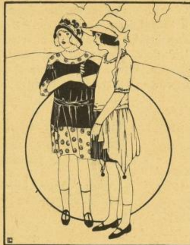
Die Neueste Deutsche Mode