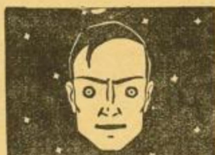
Das grosse Lehrbuch des Gedankenlesens Telepathie, Hellsehen, Enthüllungen und Unterweisungen Herausgegeben von Erwin Wulff Rudolph'sche Verlagsbuchhandlung/Dresden A 10