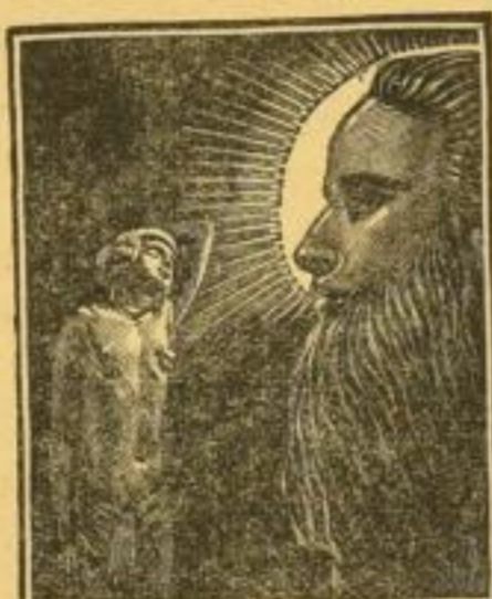
Die GEHEIMEN MÄCHTE DER HYPNOSE UND SUGGESTION Von Dr. EVANS GORDON