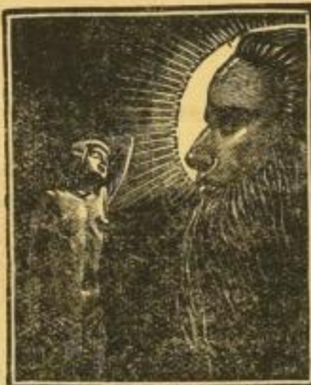
Die GEHEIMEN MÄCHTE DER HYPNOSE UND SUGGESTION Von Dr. EVANS GORDON