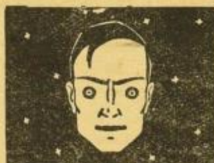
Das große Lehrbuch des Gedankenlesens Telepathie, Hellsehen, Enthüllungen und Unterweisungen Herausgegeben von Erwin Wulff

Rudolph'sche Verlagsbuchhandlung / Dresden A 16