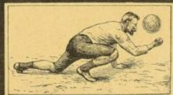
Ziehen über den Kopf

Die beiden Lieblingspiele unserer Turner