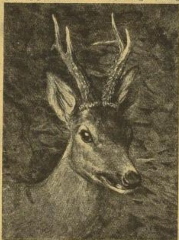
Verlag: J. Neumann, Neudamm

Herausgegeben von der Deutschen Jäger-Zeitung