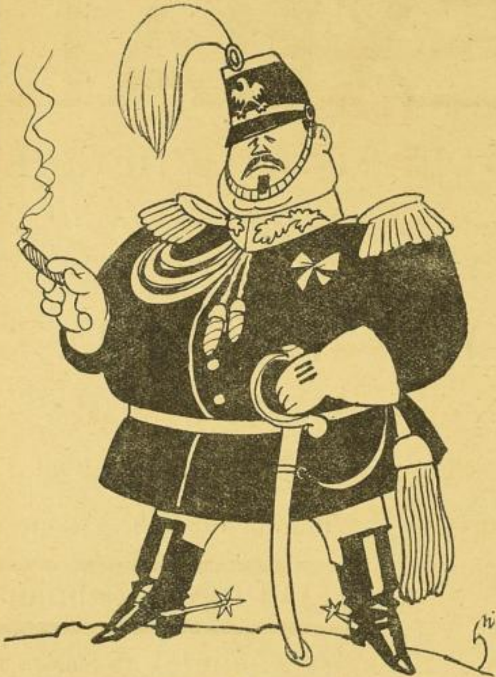
Frihe, der fürstliche Präside.

Nach Beschaffung einer Standarte ist die Anfertigung einer Uniform für den Reichspräsidenten als Generalissimus der Apo, Sipo und Schupo wichtigstes Erfordernis.