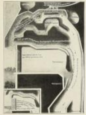
Wie die eingeatmete Luft gereinigt wird