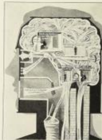
Ein Versuch, die Tätigkeit unseres Hirns anschaulich zu machen

Die hier wiedergegebenen Abbildungen sind stark verkleinert. Reproduktionen einiger Tafeln des Werkes