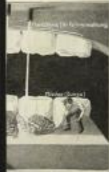
Was in unseren Mäulern geschieht, wenn wir ein Stück Brot essen

Die hier wiedergegebenen Abbildungen sind stark verkleinert. Reproduktionen einiger Tafeln des Werkes