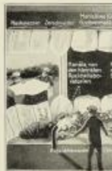
Was in unseren Mäulern geschieht, wenn wir ein Stück Brot essen