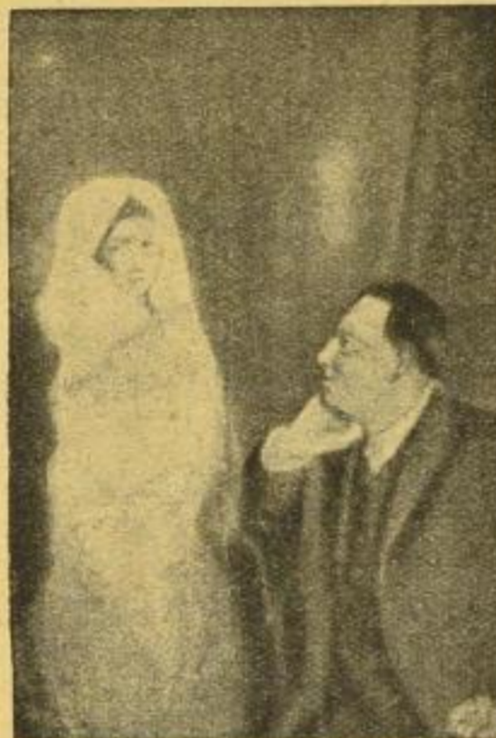
Rechts Medium, links Geist