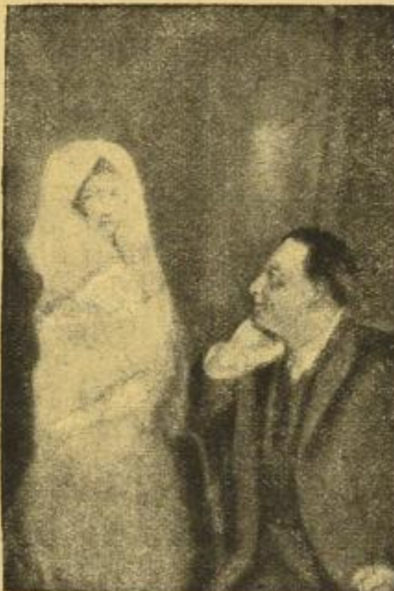
Rechts Medium, links Geist