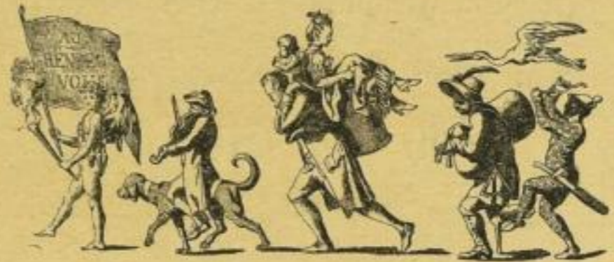
Kupferstich aus Moritz August v. Thümmel: Wilhelmine

* Alle drei Bände in zweiter Auflage Auf bestem holzfreiem Papier in Pappband 18 Mark Numer. Vorzugsausg. in Halbleder 75 Mark