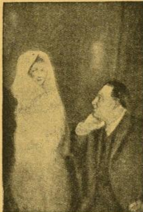
Rechts Medium, links Geist