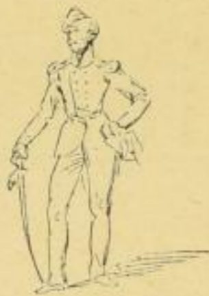
Ferdinand von Rayski