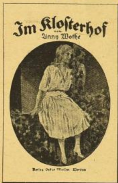
Verkleinerte Abbildung des Vierfarbendruck-Schuhumschlags