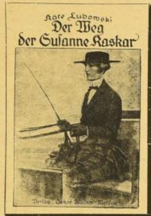
Verkleinerte Abbildung des Vierfarbendruck-Schuhumschlags

Wie in früheren Werken hat Ebenstein auch hier wieder eine nicht leicht zu übertreffende Meisterschaft bewiesen, Charaktere zu zeichnen und das Leben höherer Kreise lebenswahr zu beschreiben. Überraschend wird die Verwicklung gelöst, die aus der Liebe des Prinzen zu einer adligen jungen Dame ohne Vermögen entstanden ist.