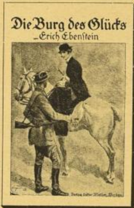
Verkleinerte Abbildung des Vierfarbendruck-Schuhumschlags