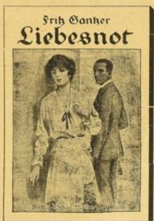
Verkleinerte Abbildung des Vierfarbendruck-Schuhumschlags

Sämtliche obigen Werke erscheinen in dem neuen gangbaren Format 13×18 cm und sind mit brillant gedruckten Vierfarben-Schuhumschlägen ausgestattet.