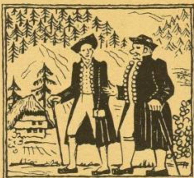
Aus: „Das Männlein vom Mummelsee“

Die Bändchen sind auf holzfreies, feinsatiniertes Papier gedruckt und mit zahlreichen Bildern geschmückt. Die Einbände der gebundenen Ausgabe von Nr. 3—6 sind in vier Farben gedruckt. Die Bändchen kosten bis Ende September fein gebunden M. 60.— ord., einfach kartoniert M. 40.— ord.