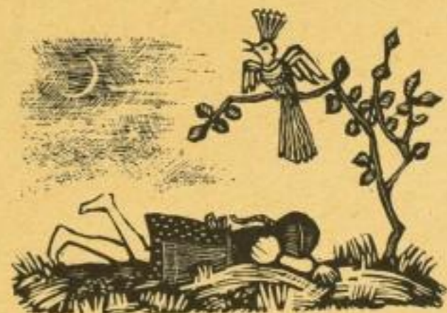
Aus: „Prinzeß Gänselore“