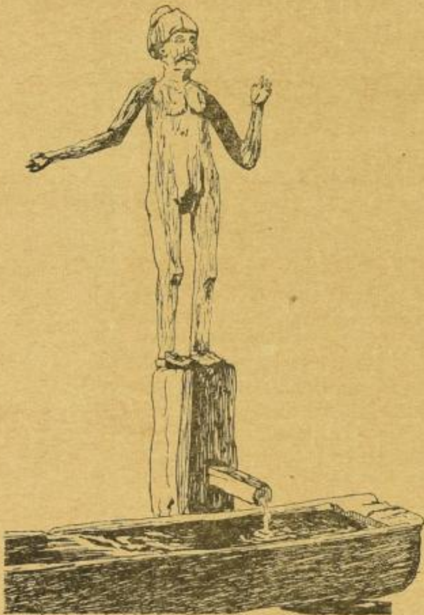
„Der Zattermann“ (Illustrationsprobe aus dem Kärntner Heimatbuch)

Das „Kärntner Heimatbuch“ bringt die Geschichte des Volkes und Landes, aufgerollt bis in die graueste Vorzeit. Was das Land seinem Volke gab und gibt, was die Kärntner