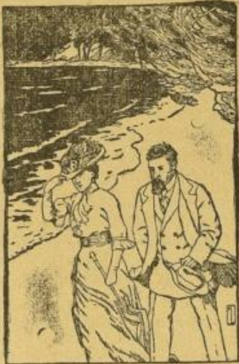
Stark verkleinerte Illustrationsprobe