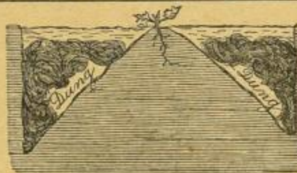
Erwärmtes Gartenbeet im Freien.