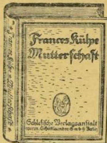
Geschenk-Einband zu Kälpe „Mutterschaft“