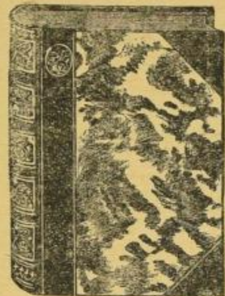
Liebhaber-Einband zu Kälpe „Mutterschaft“

ein Schicksalsroman, aber dabei ein ganz stilles, feines Buch — so lauten die Urteile