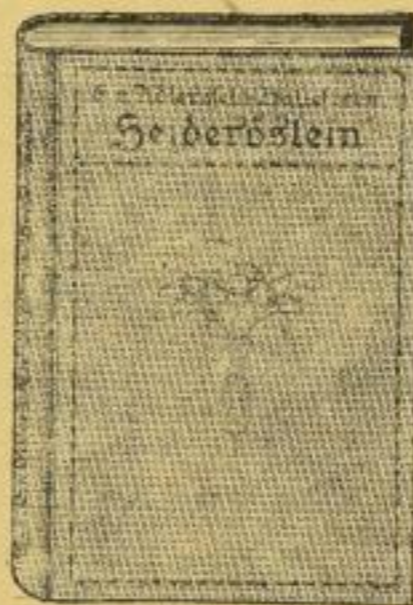
Gesch.-Einb. in Halbleinen

Einbändige Ausgabe • 631 Seiten • Reich illustriert • Bestes holzfreies Papier • Ein starker Band gebunden Sm. 8.—