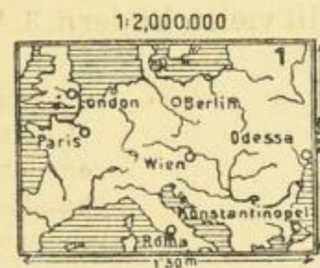
1 Blatt: 130×90 cm. M. 2.50 ord. als Wandkarte mit Stäben aufgezogen auf Leinwand M. 8.50. do. auf Leinw.-Ersatz M. 6.50

Als sehr wichtige Ergänzung erschien dazu