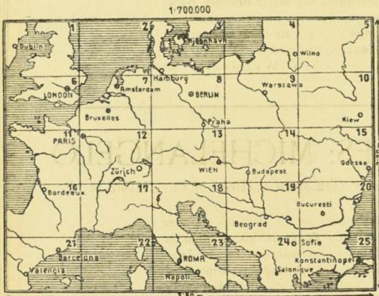
25 Blatt je 76×54 cm. M. 12.50 ord.

Diese erweiterte Neuauflage enthält sämtliche Linien Zentral-Europas einschliesslich der Kleinbahnen. Durch eine doppelte Linie sind die internationalen Hauptverkehrslinien besonders hervorgehoben, die Grenz-, Zoll- und Übergangsstationen mit eigenen Signaturen gekennzeichnet. — Sämtliche Stationen führen den heute in ihrem Staate gültigen Namen. Titel und Zeichenerklärung sind in deutscher, englischer und französischer Sprache verfasst.