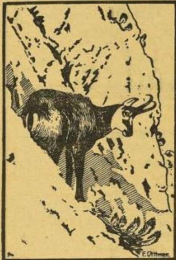
Nach einem Kunstlichtbild im Werke gezeichnet von F. Dittmer, München

ÖSTERR. VERLAGS- GESELLSCHAFT ED. HÖLZEL & Co. WIEN III.