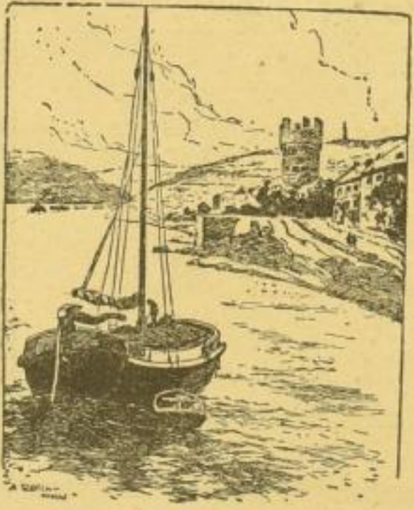
A. Reich, Der Rhein bei Rüdesheim