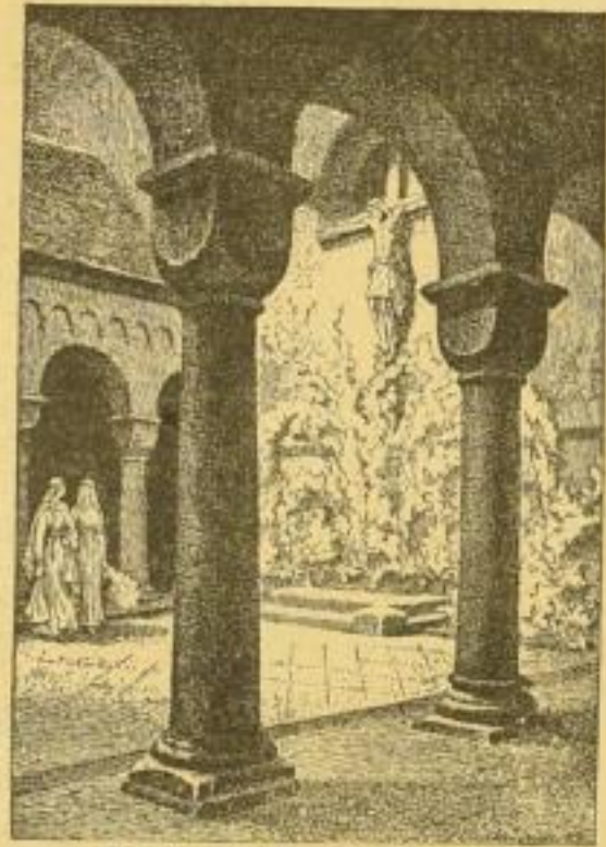
M. Thiele, Essen, „Das Paradies“