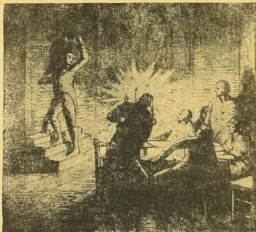
1. Akt. 1. Szene.