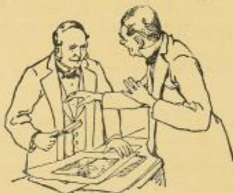
Die Drappen an der 1927

herstellen lassen, die die köstlichen Szenen im Hause des alten Buchhändler-Originals Bräunslow in Neuhändenburg trefflich ergänzen.