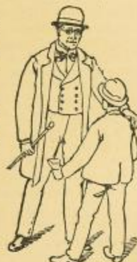
Ein Großvater und der junge Osten

Wir bitten um baldige, recht zahlreiche Bestellungen.