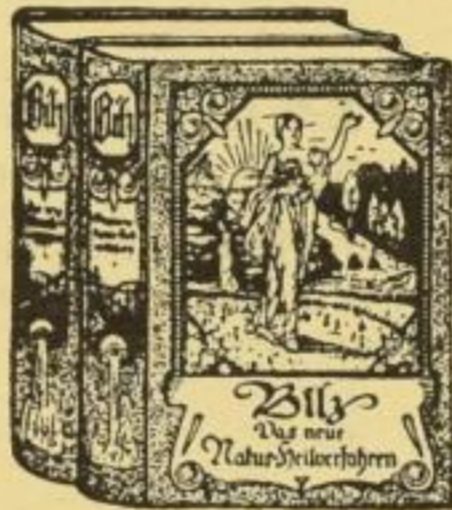
Stark verkleinerte Wiedergabe. Natürliche Größe: 16 x 24 cm.

Der neue Bilz mit Einschluß der Biologie ist ärztlich durchgesehen, neuzeitlich verbessert u. textlich bedeutend erweitert. Er behandelt in nachstehenden 12 Abschnitten alle Krankheiten ausführlich und gibt dafür Kurvorschriften bei Anwendung der Natur- und Wasserheilmethoden, der Kneipp-, Diät- und Kräuterkuren, sowie der Homöopathie und der heute sehr begehrten Biochemie, ferner der Bestrahlungstherapie durch