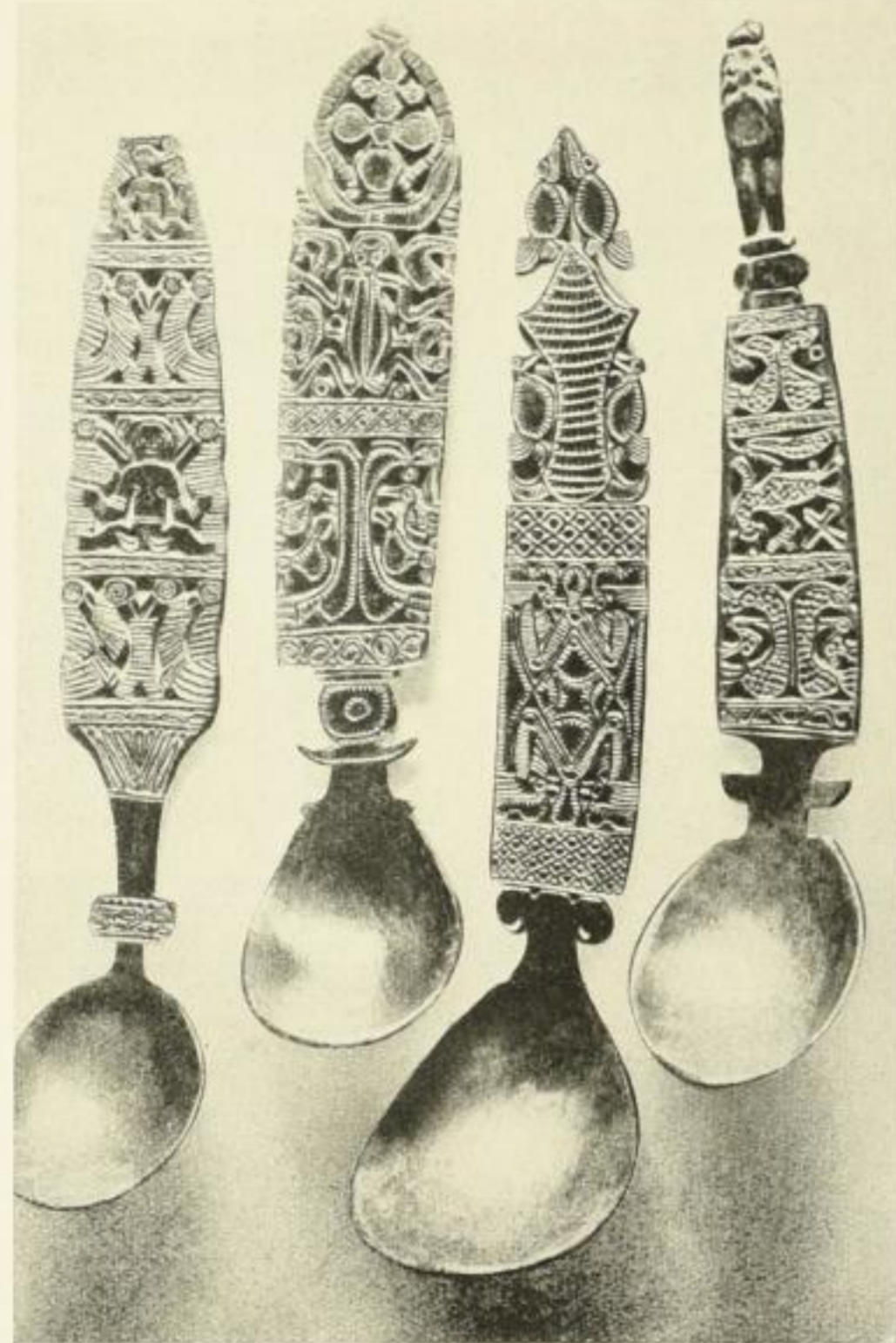
AUS „MALAIEN“ LÖFFEL AUS HORN (TIMOR)