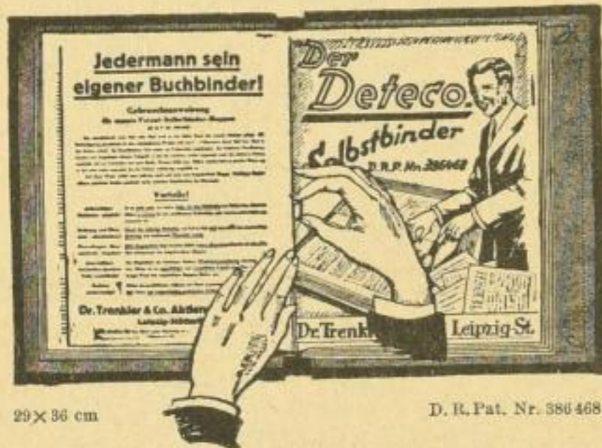
29 x 36 cm

Prospekt mit ausführlicher Gebrauchsanweisung zu Diensten