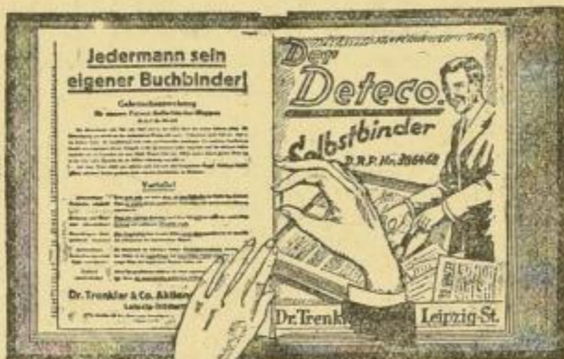
29 x 36 cm

Prospekt mit ausführlicher Gebrauchsanweisung zu Diensten