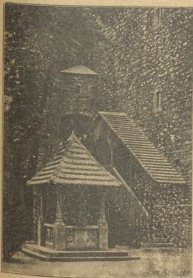
Der Brunnen auf Burg Grödigberg i. Schl.