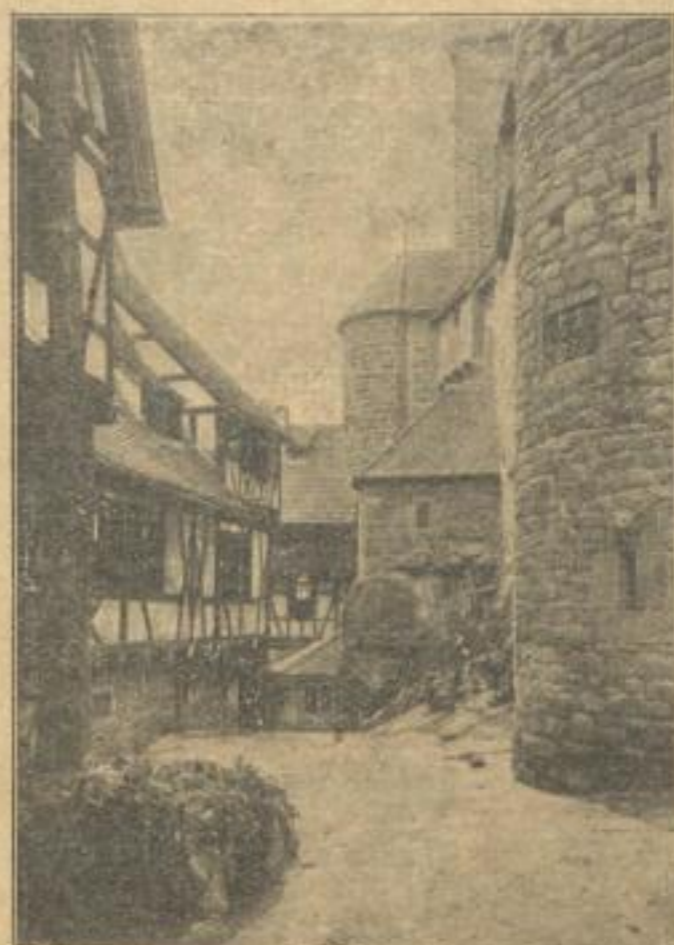
Im Burghof der Hohenkönigsburg

Ein neues, wundervolles Buch von Deutschlands Burgen mit prachtvollen Bildern in Kupfer-Tiefdruck