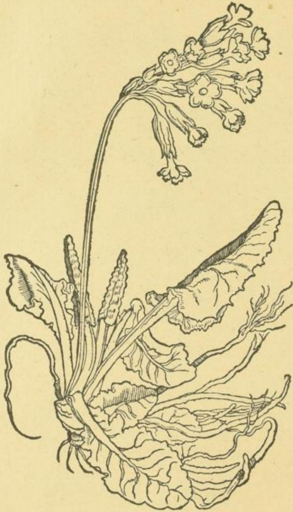
Tafel 12. Schlüsselblume ( Primula officinalis ) Treibt den Schweiß und den Harn