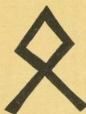
ogal = Besitz