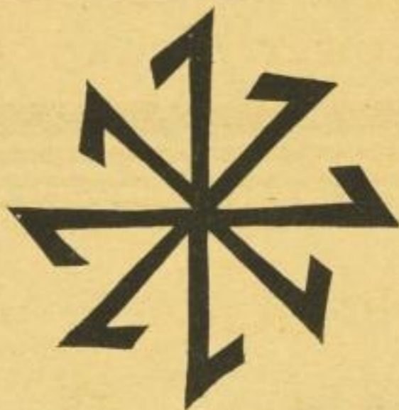
Das Femzeichen oder Ahtrecht