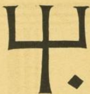
Hausmarke der Fugger