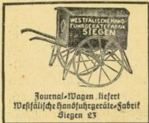
Journal-Wagen liefert Westfälische Handfuhrgeräte-Fabrik Siegen 23

G. Strübing's Verlag, Leipzig (W. Altmann).