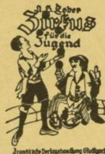
Franckhsche Verlagshandlung Stuttgart

Welcher Bub und welches Mädchel wäre da nicht dabei?