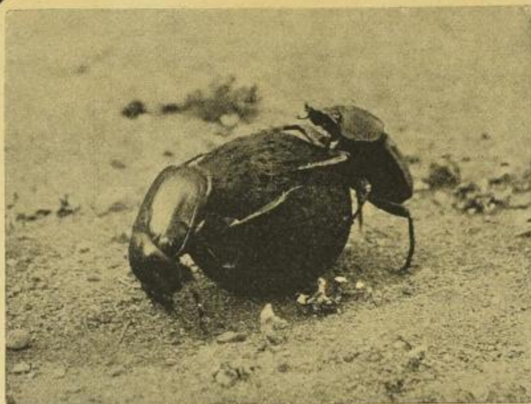
Skarabäen, einen Futterballen wälzend