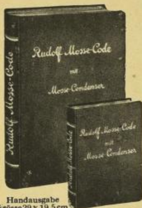
Handausgabe Grösse 29 x 19,5 cm