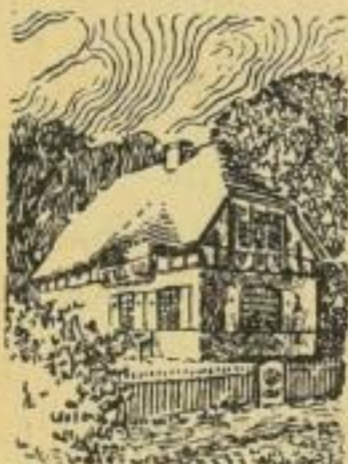
Abb. 72: Schaubild