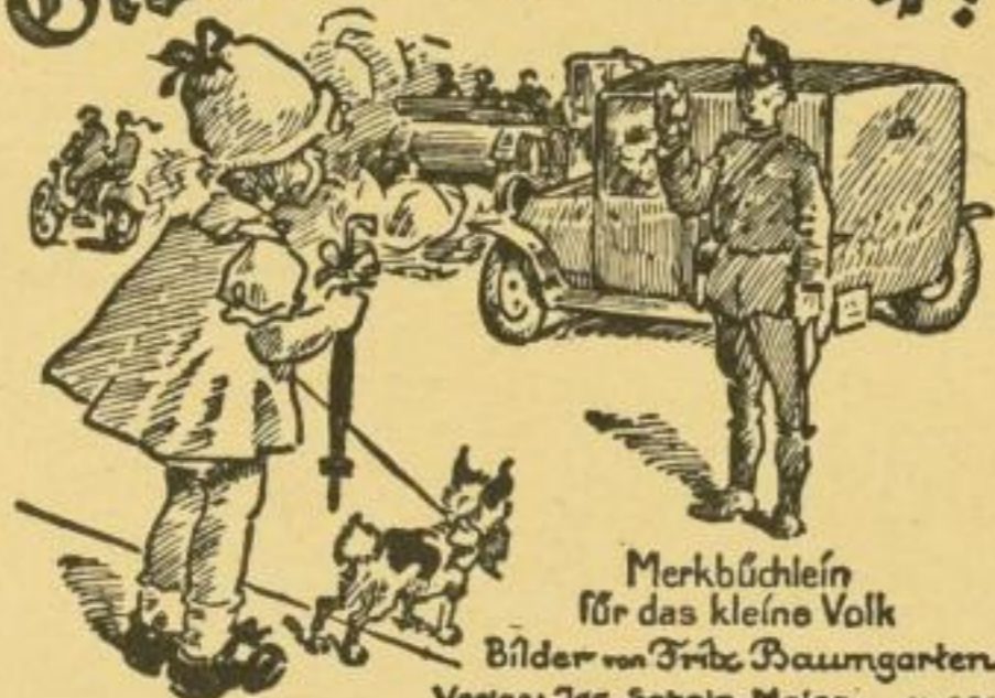
Merkbüchlein für das kleine Volk Bilder von Fritz Baumgarten Verlag: Jos. Scholz, Mainz. Nr. 901

Ein Büchlein, das den Kindern die Verkehrsgefahren der Straße und die Verkehrsregeln in einer in Wort und Bild einprägsamen und doch nicht derben Weise vorführt, und das zu Nutzen und zum Vergnügen der Kinder zugleich recht oft gekauft werden dürfte. Es enthält 15 bunte Bildseiten, die sich harmonikaartig auseinanderziehen lassen, mit buntem Titelbild und festem Kartoneinband, 13 : 11 cm groß.