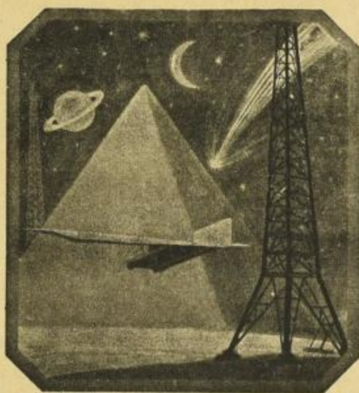
Verkleinerte und vereinfachte Wiedergaben der Einbandbilder (Im Original in Vierfarbendruck!)