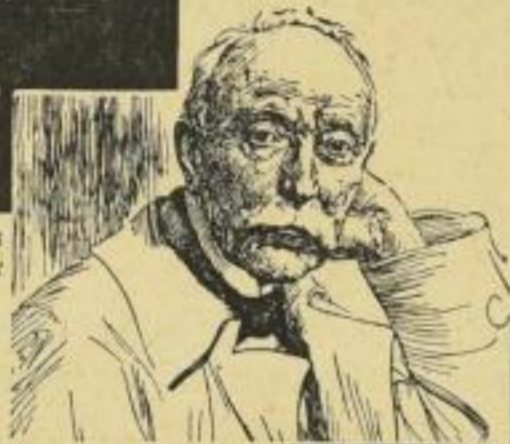
Federzeichnung von Karl Bauer