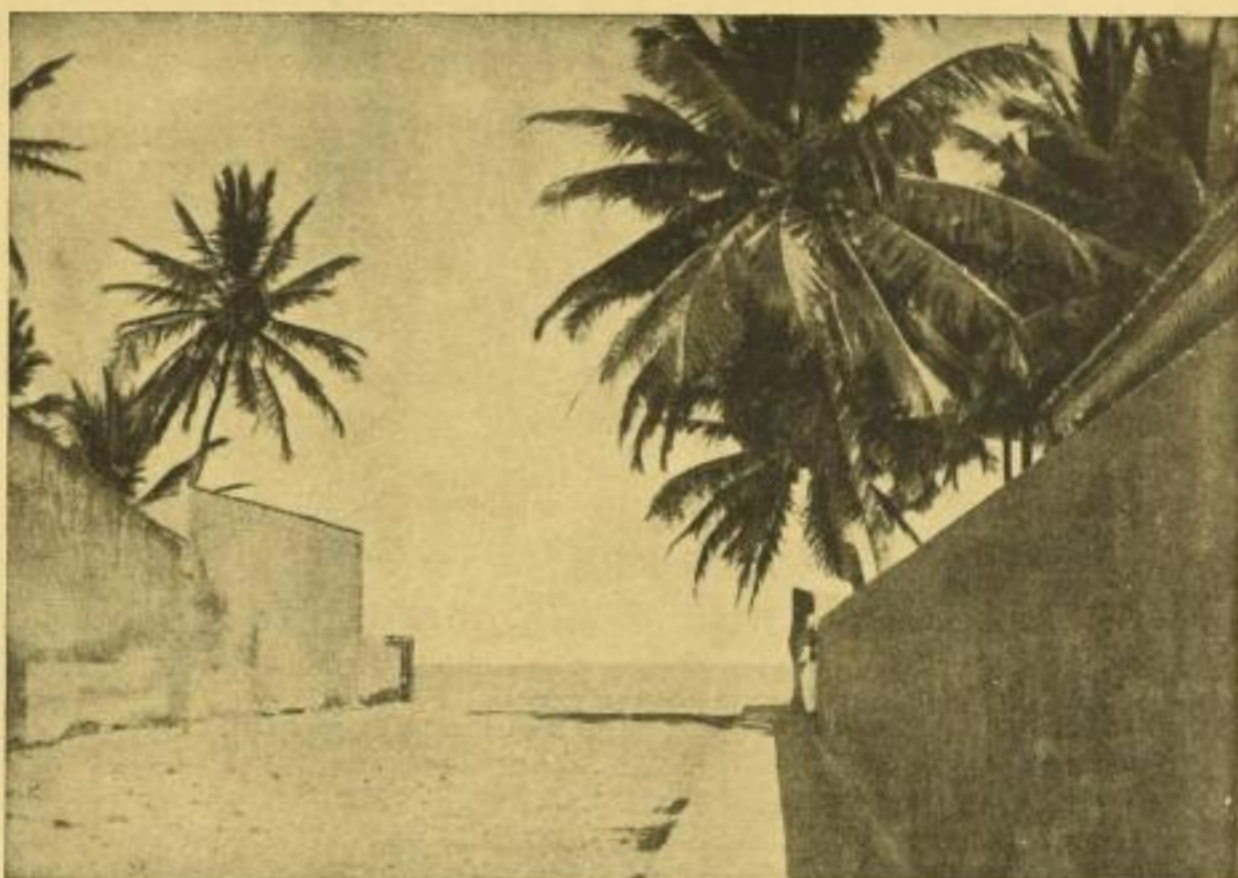
Kokospalmen in Olinda

und Reisende finden in dem Buch einen Führer für jeden, der Brasilien besuchen oder dort leben will. Der heimischen Geschäftswelt, die mit den südamerikanischen Staaten in Verbindung steht, vermittelt das Buch Verständnis für die wirtschaftlichen Verhältnisse des Landes und seine Reichtümer.