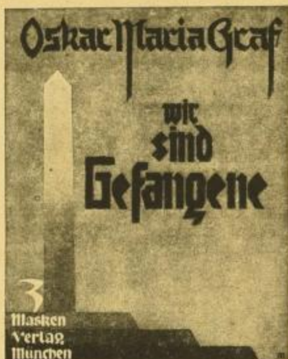
Verkleinertes Bild des mehrfarbigen Schutzumschlages zu