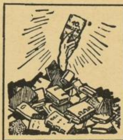
Jeder Band in Ganzleinen M. 4.—

Otto Elsner Verlagsgesellschaft m. b. H. / Berlin S 42