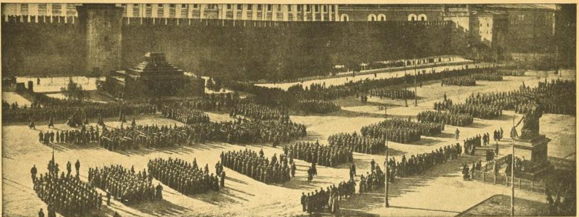
Parade der Roten Armee vor Lenins Grabmal

Das Buch hat in der Presse der ganzen Welt enthusiastische Würdigung gefunden und wird allgemein als eine der bedeutendsten kulturpolitischen Arbeiten der Gegenwart bezeichnet. Wer sich über Sowjetrußland, seine Kultur, seine politische und wirtschaftliche Entwicklung innerhalb der letzten zehn Jahre informieren will, findet hier auf jede Frage eine erschöpfende und unparteiische Antwort.