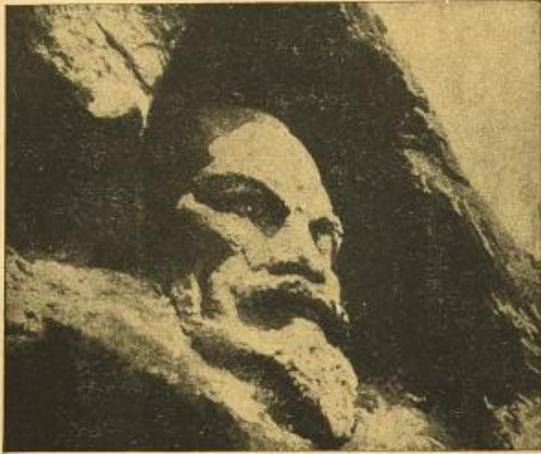
Kopf Lenins aus einem Felsen gehauen

Begeisterte Pressestimmen aus allen Erdteilen Europa Afrika