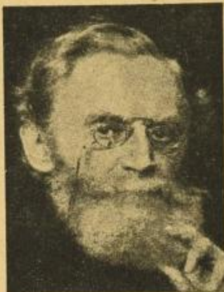
Karl Schurz, Minister des Innern