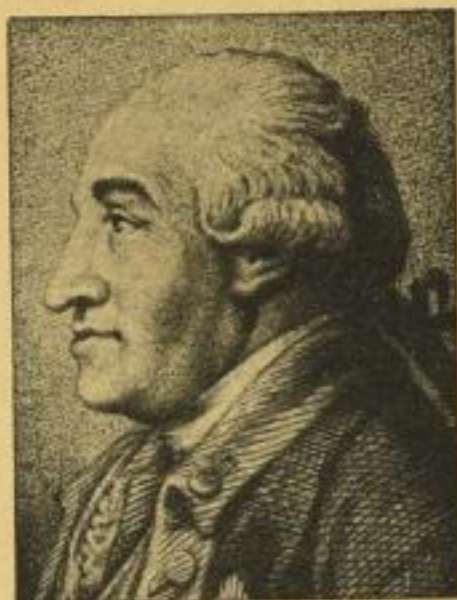
General von Steuben, der Organisator der amerik. Armee

Aprilheft der Monatschrift „Deutschlands Erneuerung“