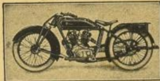
2. Preis: 1 Wanderer-Motorrad 750 ccm. . . . . RM. 1950,—