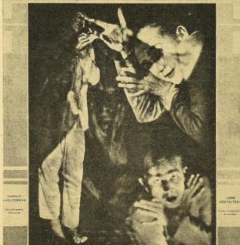
HERAUSGEBER DIETER BASSERMANN VERLAG ROTHGIESSER & DIESING AKT.-GES. BERLIN