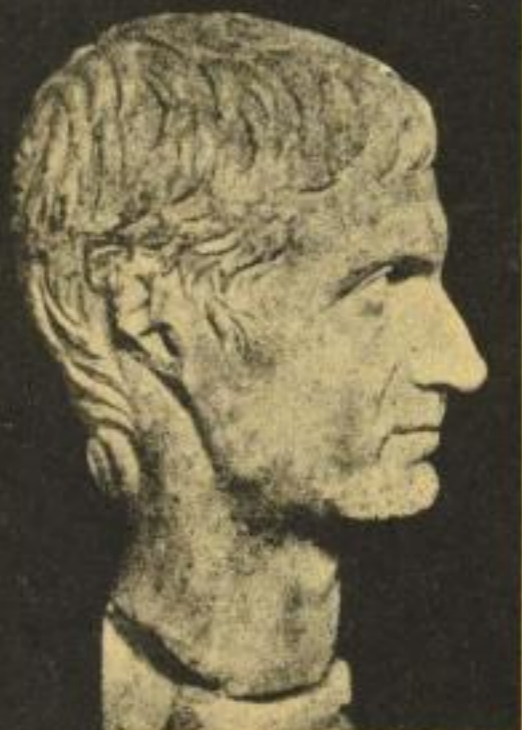
Römer, Beginn der Kaiserzeit

Die Ursachen des Rassenwandels und des mit ihm verknüpften Untergangs der Antike