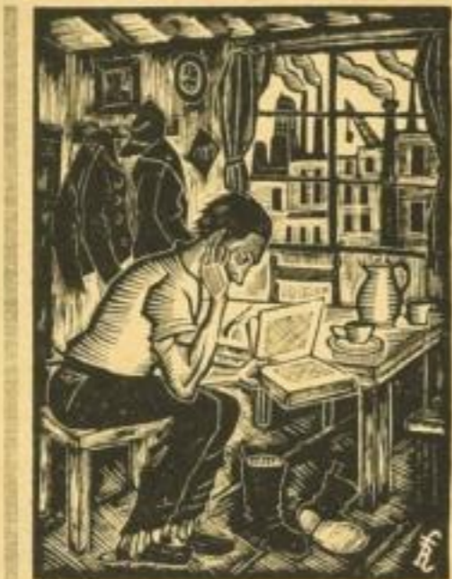
ILLUSTRATION VON ERIC THURBERG

NEUE BÜCHER DES MONATS 6. JAHRGANG 1929 HEFT 1